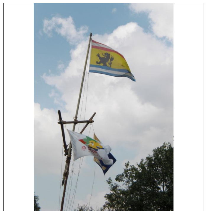
De Zeeuwsch Vlaamse vlag wappert nog altijd fier in top.