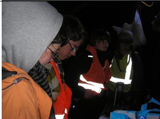
Briefing oudste verkenners voorafgaand aan dropping Cobra's

In de ochtend gingen we om brood bij de receptie. Het brood was erg lekker. Het ging ineens heel hard regenen. Toen moesten we naar de leiding we waren kletsnat. En we gingen toen met de auto naar het zwembad van Ronse. Eigenlijk gingen we naar Kluisberg maar dat ging niet door. Het was te nat toen we er waren moesten we even wachten. Toen gingen we naar de receptie, je mocht geen lange zwembroek aan, dat was stom. In een strakzwembroekje. Het was lekker zwemmen, het water was lekker warm, bijna iedereen ging van de duikplank. We gingen lopend terug, het was best zwaar. Toen we terug waren gingen we stampot eten, het eten was lekker.