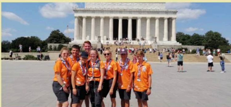
Deze foto is genomen voor het Lincoln Memorial in Washington D.C. op de World Jamboree in 2019.